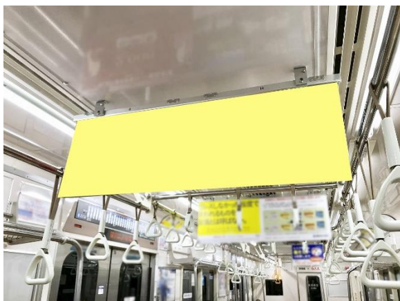
▲ 中ぶりポスター ワイドサイズ