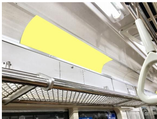
▲ 窓上ポスター インターサイズ (ワイド)