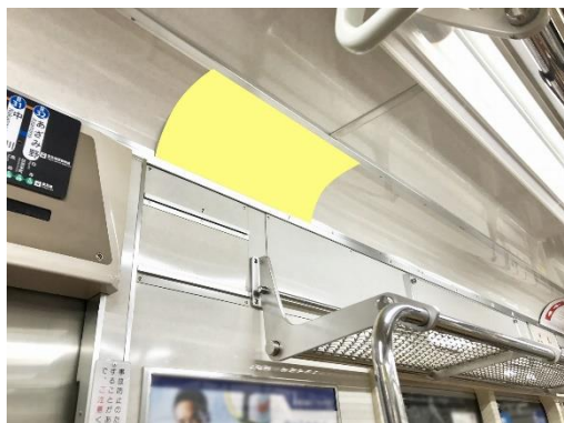
▲ 窓上ポスター インターサイズ (シングル)

新規・復活クライアント限定で 長期契約20%OFF!! 6ヶ月契約、年間契約が対象となります。(初回の契約のみ適用)